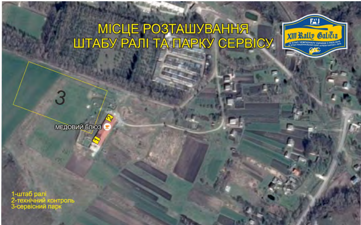
СХЕМА РОЗТАШУВАННЯ ШТАБУ ТА ПАРКУ СЕРВІУ РАЛІ «XIII РАЛІ ГАЛІЦІЯ»